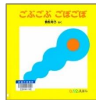
ごぶごぶ ごぼごぼ 駒形克己/さく 福音館書店

「ぷーん」「ぶく ぶく ぶく ぶくん」「ぶ ぶ …」などの言葉(音)の響きがリズムカルで、色鮮やかな丸の動きも楽しい絵本です。赤ちゃんも不思議と笑顔になりますよ。