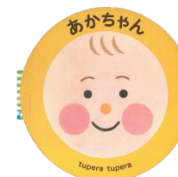
あかちゃん tupera tupera/作 ブロンズ新社

「ぷーん」「ぶく ぶく ぶく ぶくん」「ぶ ぶ …」などの言葉(音)の響きがリズムカルで、色鮮やかな丸の動きも楽しい絵本です。赤ちゃんも不思議と笑顔になりますよ。