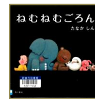
ねむねむごろん たなかしん/作・絵 KADOKAWA

手足がついただるまさんが、右にゆらゆら、左にゆらゆら揺れて「どてっ」と転びます。 ユーモラスなだるまさんの表情に笑顔がこぼれます。