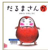
だるまさんが かがくいひろし/さく ブロンズ新社

まあいフォルムのやさしい黄色が、つい手にとってみたくくなります。“まんまる”は赤ちゃんの好きなもの。ページをめくれば出てくる、出てくる！でもやっぱり一番好きなのは“コレ”かな！