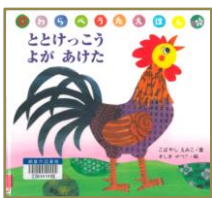
ととけっこう よが あけた こばやしえみこ/案 ましませつこ/絵 こぐま社

長い間読み継がれている本。「いないいないばあ」とページをめくると動物が「ばあ」と顔を出します。この繰り返しは赤ちゃんは大好き！スキップを深めるにはもってこいの一冊です。