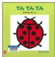
てんてんてん わかやましずこ/さく 福音館書店

げんきなにわとりさんが、みんなを起こしてまわります。わらべうたをもとにしたシンプルなお話を絵で楽しく展開。朝やおひるねの目覚めのときにうたいたい、親子で一緒に楽しめるわらべうた絵本です。