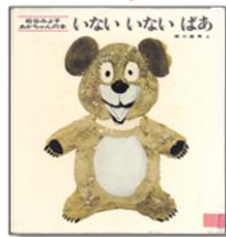
いない いない ばあ 松谷みよ子/文 瀬川康男/画 童心社

ジッとこちらをみている犬クン、あかちゃん、おさるさん…“こちょこちょこちょー!!”とやるとみーんな大笑い。「きゃっ、きゃっ、きゃっ、」「ぶっ、ぶっ、ぶっ」と声に出して読んでみて！笑いが止まらなくなることうけあいです。