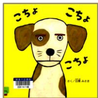
こちょこちょこちょ 日隈みさき/さく エンブックス

ジッとこちらをみている犬クン、あかちゃん、おさるさん…“こちょこちょこちょー!!”とやるとみーんな大笑い。「きゃっ、きゃっ、きゃっ、」「ぶっ、ぶっ、ぶっ」と声に出して読んでみて！笑いが止まらなくなることうけあいです。