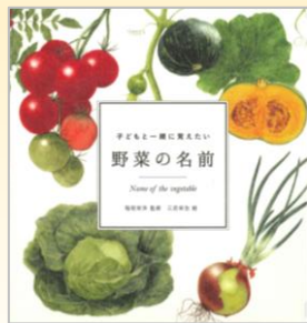
『子どもと一緒に覚えたい 野菜の名前』 稲垣 栄洋/監修 マイルスタッフ