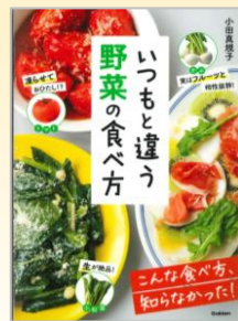
『いつもと違う 野菜の食べ方』 小田 真規子/著 Gakken