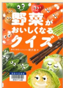
『野菜がおいしくなる クイズ』 緒方 湊/著 飛鳥新社