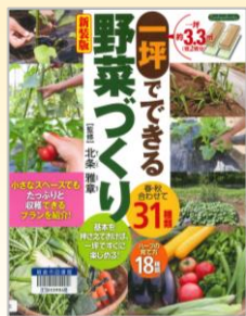
『一坪でできる 野菜づくり』 北条 雅章/監修 ブティック社