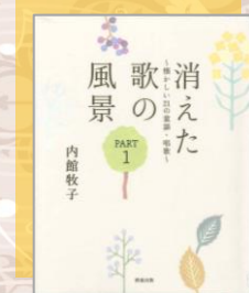
『消えた歌の風景』 内館牧子／著 清流出版