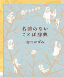
『名前のないことば辞典』 出口かずみ／著 遊泳舎

例えば「そのとき、とてもこちよい音が聞こえた」という文字を見て、あなたの頭の中ではどんな音が聞こえましたか？ 文章から音が聞こえそうな本を集めました。