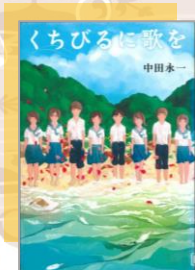
『くちびるに歌を』 中田永一／著 小学館