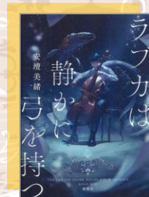
『ラブカは静かに弓を持つ』 安壇美緒／著 集英社