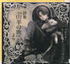
詩集『山羊の歌』より 中原中也／著 立東舎